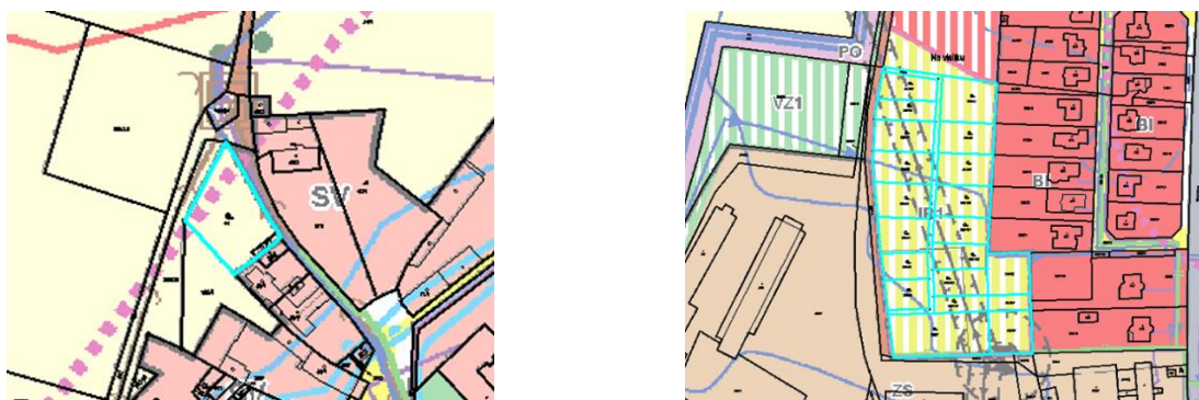
Obr. D.3, D.4 výřezy koordinčního výkresu ÚP Bohušovice nad Ohří s vyznačením pozemků dotčených návrhy na změnu územního plánu č. 3) a 4)