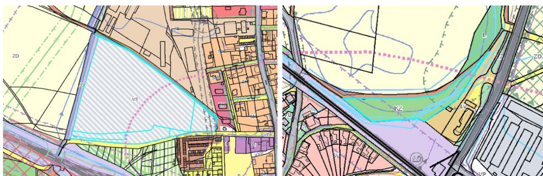
Obr. D.9, D.10 výřezy koordinačního výkresu ÚP Bohušovice nad Ohří s vyznačením pozemků dotčených návrhy na změnu územního plánu č. 10) a 11)

Katastrální území Bohušovice n. O. nabízí relativní dostatek nevyužitých zastavitelných ploch. Z pokynů vzešlých ze strany zastupitelstva města bude prověřeno vymezení jedné nové zastavitelné plochy pro umístění fotovoltaické elektrárny.