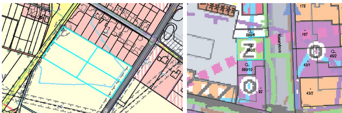
Obr. D.5, D.6 výřezy koordinačního výkresu ÚP Bohušovice nad Ohří s vyznačením pozemků dotčených návrhy na změnu územního plánu č. 5) a 6)