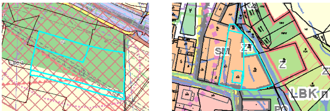
Obr. D.1, D.2 výřezy koordinčního výkresu ÚP Bohušovice nad Ohří s vyznačením pozemků dotčených návrhy na změnu územního plánu č. 1) a 2)