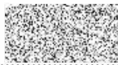
Jiřina Hudcová starostka obce Vrutice