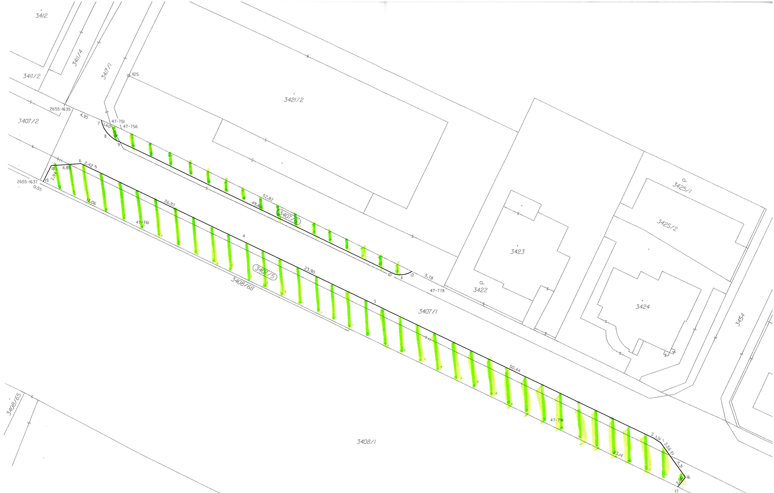
Seznam souřadnic bodů (S-JTSK)